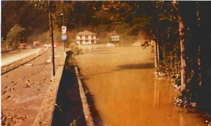
La statale Verrès-Saint Vincent, completamente allagata all'altezza di Torille, i giorni dopo l'alluvione dell' ottobre 2000.